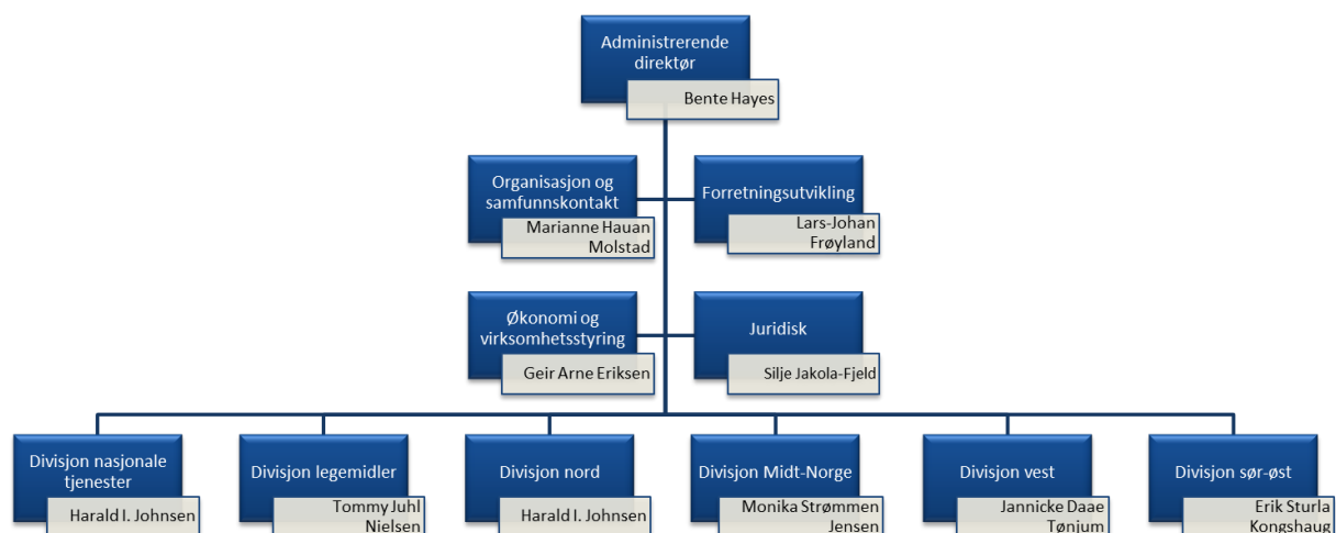
Figur 2: Organisasjonskart

Pr. 31. desember 2022 hadde Sykehusinnkjøp HF totalt 316 ansatte; 299 fast ansatte og 17 ansatte i vikariat, engasjement og lærlingordning, fordelt på følgende enheter: