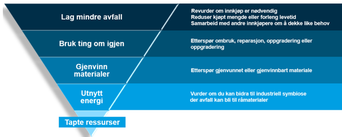
Figur 2: Sjekkliste for Leder - anskaffelse; følg prinsippene i avfallshierarkiet. Kilde: Figur etter modell av DFØs avfallshierarki 6 .

Helseforetakenes anskaffelser bør følge prioriteringene i avfallshierarkiet (se figur nedenfor). Man bør forsøke å finne løsninger så høyt oppe i hierarkiet som mulig. Målet er å redusere mengden ressurser som forsvinner ut av kretsløpet.